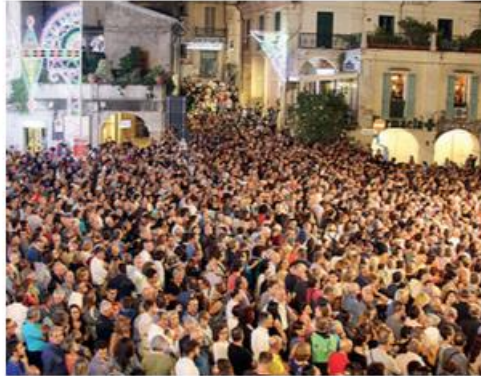
La folla ieri sera in piazza Plebiscito. Sotto, i telefonini puntati su Ranieri

Massimo Ranieri ha portato in scena uno spettacolo completo fatto di momenti di racconto, di teatro e di musica. Oltre ai successi del cantautore partenopeo come "Se bruciasse la città", "Rose ros-