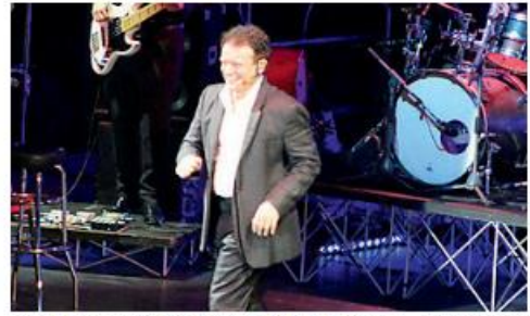
Massimo Ranieri durante lo spettacolo di domenica sera