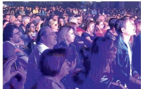
Il pubblico a uno degli spettacoli in piazza Plebiscito