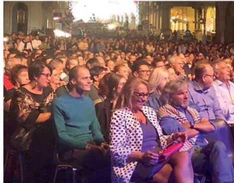
Ore 21,50: il pubblico in piazza Plebiscito in attesa del concerto