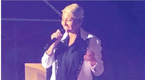
Malika Ayane ieri sera sul palco di piazza Plebiscito