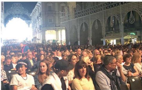
Il pubblico seduto allo spettacolo di Malika Ayane