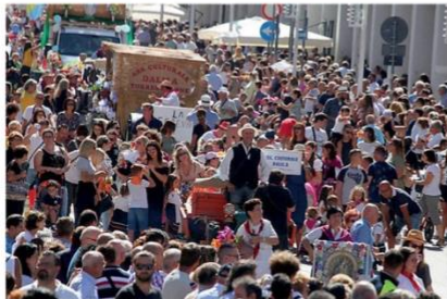
In migliaia in piazza a Lanciano per il Dono

Grandi e piccini non hanno voluto perdersi il Dono, che si celebra in occasione della natività della Vergine e della fine dei raccolti, aprendo una settimana di feste che prevede anchela Nottata (venerdì). Intanto, complice la giornata di domenica e il bel tempo, l'evento di ieri ha richiamato migliaia di persone come non si vedeva da tempo. I bimbi, in prima linea, pronti ad accaparrarsi le caramelle, ma anche pane e olio e pizzette. Ai più grandi sono arrivati bicchieri di vino e panini con la porchetta. I contradaioli in-