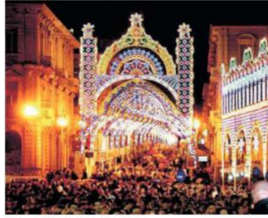
Le feste di Settembre a Lanciano